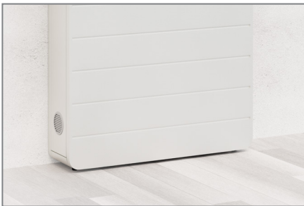
Stellfüße unter dem Korpus sorgen bei Bedarf für einen Niveaueingleich