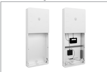
AV-Zubehör findet im Inneren problemlos Platz