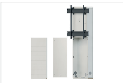
Einfache Montage durch herausnehmbare AV-Montageplatte